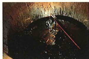
▲蒸練された梅肉エキス

* 蒸練とは…「蒸練機」という圧力と温度制御ができる密閉釜で、直火ではなく高温の蒸気を利用し、攪拌しながら煮がすことなく長時間かけて煎じる工程です。この最終工程で、水飴のような粘度の高い梅肉エキスが生まれます。